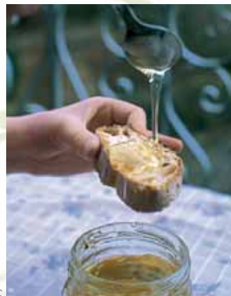
Miel marqué produit du Parc