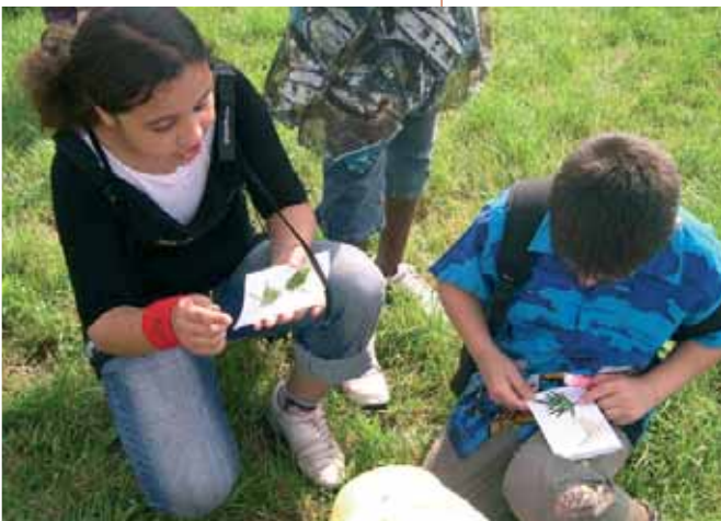
Jeu de reconnaissance des végétaux

*le texte de référence qui fixe les mesures et les orientations du Parc pour une période de 12 ans