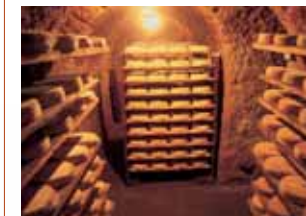
Cave à Saint-Nectaire