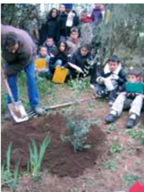
Plantation d'un arbre par l'école Jean de la Fontaine Clermont-Ferrand