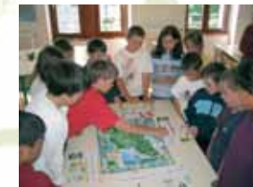
Parc en jeu