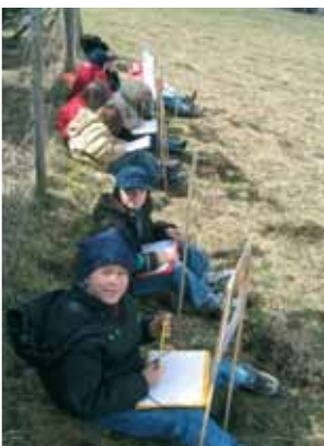
Lecture de paysage par l'école de Vermines