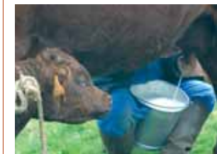
Traite de la vache Salers