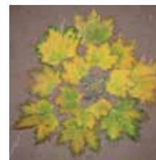
Land Art école Jean de la Fontaine, Clermont-Ferrand, Echanges ville-campagne 2007-2008