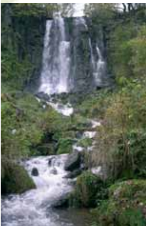
Cascade de Vaucoux

Le programme d'éducation au développement durable à l'école élémentaire (cycle 3) peut être illustré par les sujets suivants, abordables à proximité des écoles résidant sur le territoire du Parc.