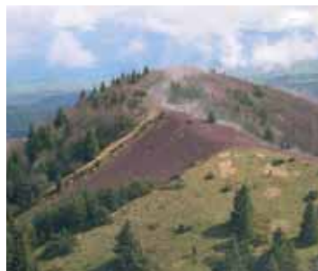
Puy de la Vache